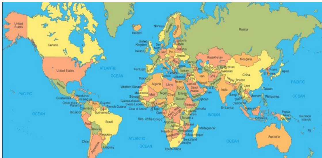
Политичка карта света