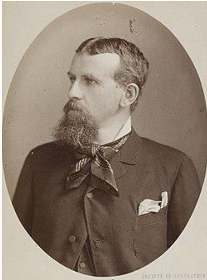
Фридрих Рацел оснивач друштвене географије